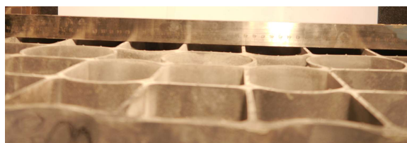
Fot. 3. Krata IG40 po obciążeniu 57,5kN