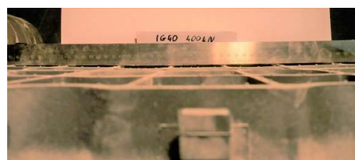
Fot. 6. Krata IG40 po odciążeniu 400kN