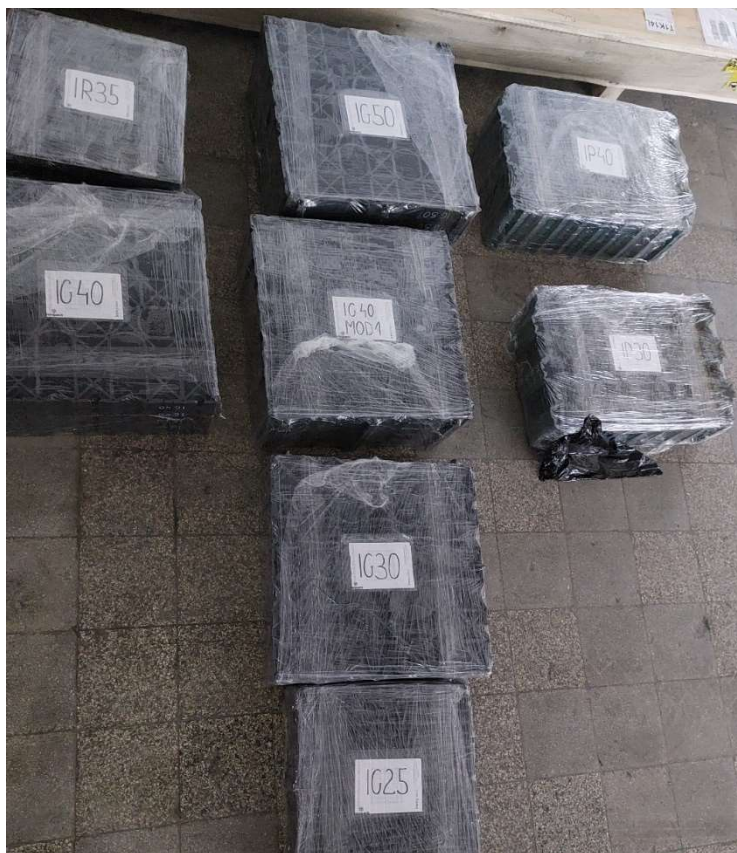
Fot. 1 Próbki do badań

Próbki dostarczono na palecie. W trakcie rozpakowywania nie stwierdzono żadnych uszkodzeń.