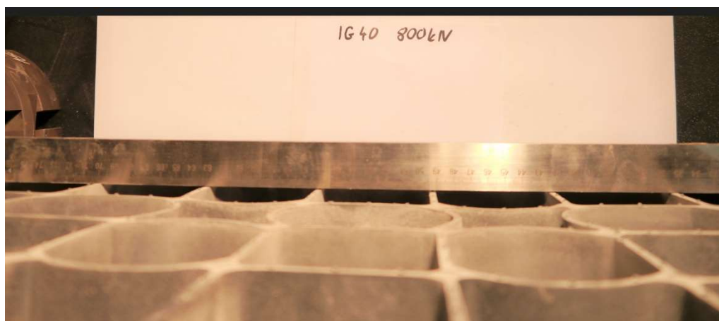
Fot. 7. Krata IG40 po obciążeniu 800kN