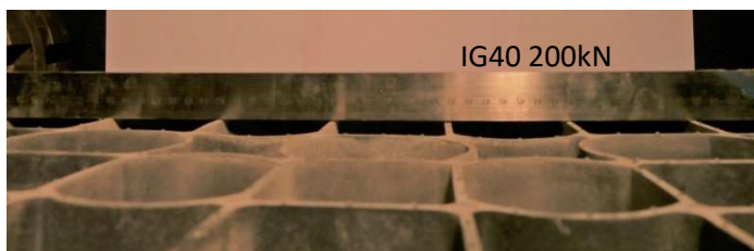
Fot. 5. Krata IG40 po obciążeniu 200kN