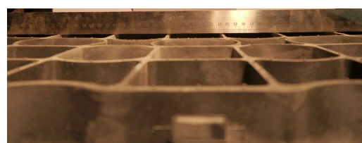
Fot. 4. Krata IG40 po odciążeniu 80kN